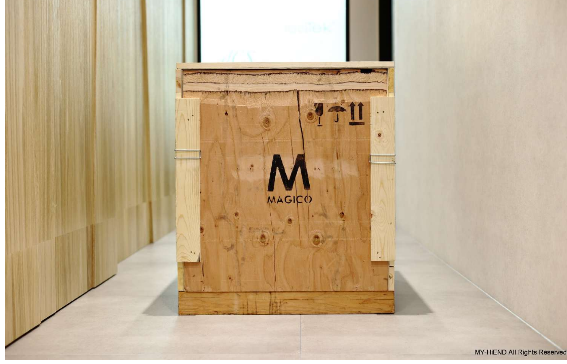
MY-HIEND All Rights Reserved

8月興山音響展復音音響展房(V前106)的非常有趣，許多新品將首次亮相，美國High End揚聲器大廠Magico最新的旗艦主動式超低音TITAN 15已於日前抵達復音音響，MY-HIEND也前往進行第一手拍攝的開箱報導，一睹為快。TITAN 15是Magico挑戰市面上最完美超低音的最新成就，目標在於再生出最完整、最真實與最低失真率再生的可能。TITAN 15擁有一個非常精準設計的控制中心，兩顆反向對稱的超低音單體，安置在航鈦合金的密封式箱體中，TITAN的頻率響應低至10Hz，已遠遠超過人耳能聆聽的極限。