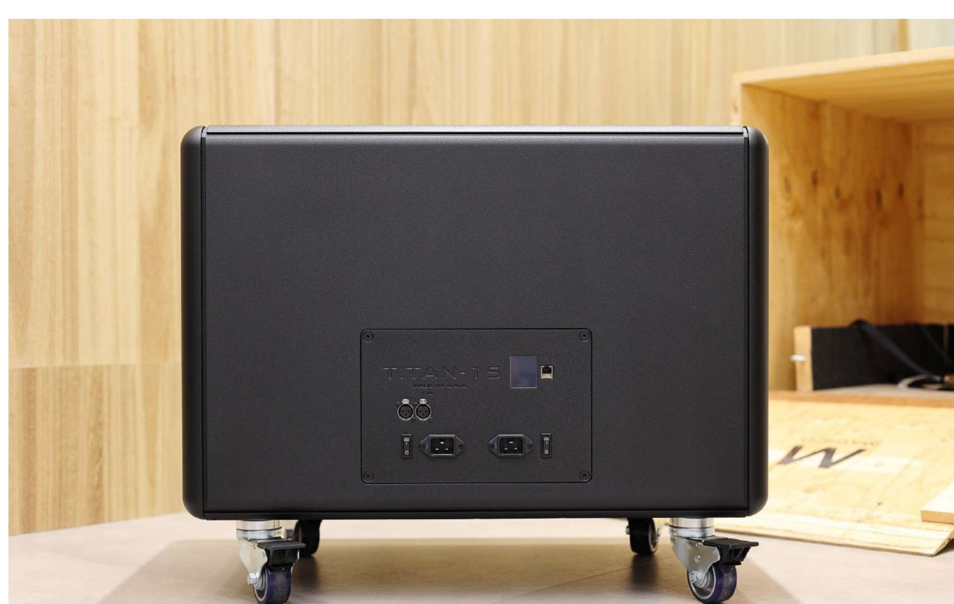
MY-HIEND All Rights Reserved

TITAN 15需使用兩條電源線，才有辦法滿足其強大的電流需求，其備有獨立開關，類比輸入訊號有XLR，另有一個網路介面以供設定之用。