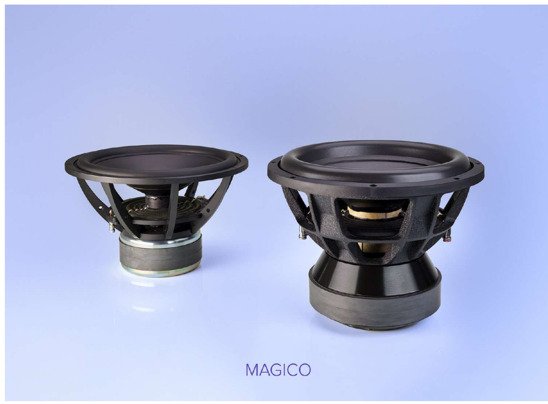
採用兩顆單體對背設計可完全消除多餘的聲壓與能量，代價是成本立刻多出一倍，TITAN 15的單體採用航鈦合金CNC加工製成。