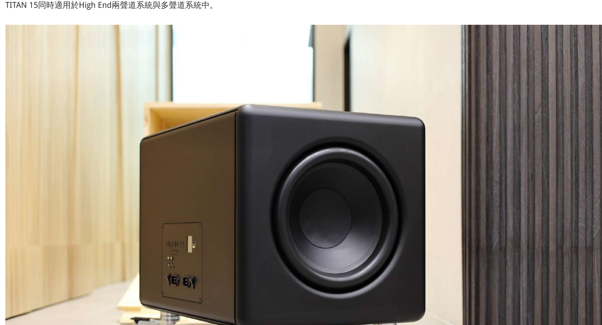
MY-HIEND All Rights Reserved